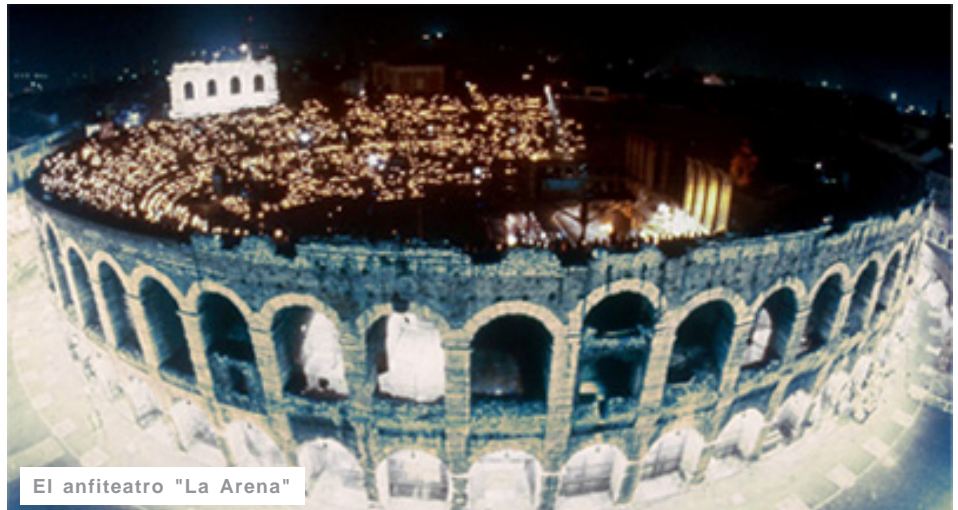
El anfiteatro "La Arena"

Zenatello fue el primer Radamés, y su esposa, la española María Gay, la primera Amneris. Después de ellos no ha habido cantante lírico que no haya aspirado a actuar, en algún momento de su carrera, en el más grande teatro de ópera del mundo.