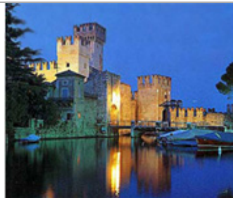
Panorámica del lago de Garda