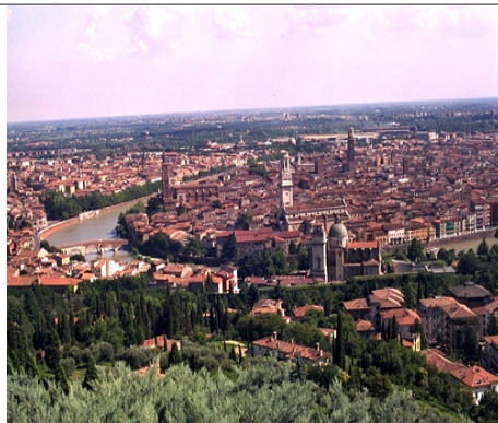
Panorámica de Verona

Es muy probable que ya haya asistido al festival en "La Arena" con anterioridad, pero aquí le ofrecemos la posibilidad de conocer localidades tan renombradas como Bardolino y Sirmione en el lago de Garda y un completísimo itinerario verdiano: la casa natal en Roncole; Busseto, encantadora ciudad donde el maestro vivió muchos años de juventud y dejó ya muestras de su genialidad creadora ( Il trovatore y Rigoletto , entre otros). Por último Villa Sant'Agata, residencia que compartió con Giuseppina Strepponi y donde se gestaron las grandes obras desde Aida en adelante.